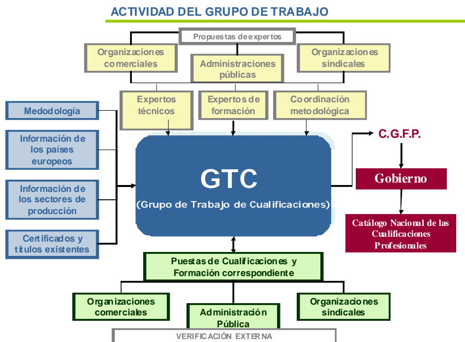
Gráfico 3: Relación para desarrollar las cualificaciones

La tabla muestra el funcionamiento de los grupos de trabajo e ilustra la cooperación existente y los mecanismos acordados sobre el desarrollo de las cualificaciones que traerán ofertas educativas y formación de acuerdos con las necesidades de empleo.