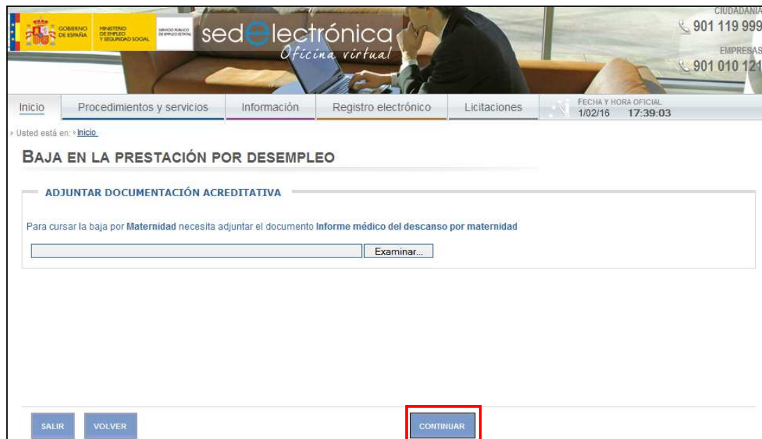
Ilustración 3: Documentación acreditativa

III) En el caso de que la causa de la baja sea acreditada por un médico se deben adjuntar los informes pertinentes.