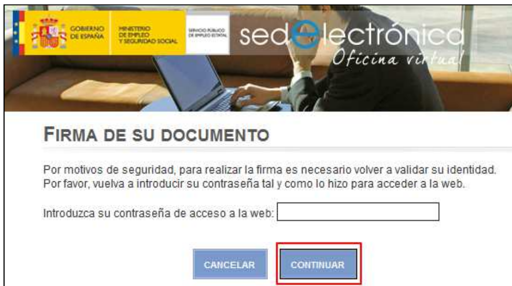
Ilustración 5: Firma del documento

V) Finalmente se solicitará la introducción de la contraseña del usuario o del DNI electrónico a modo de firma: