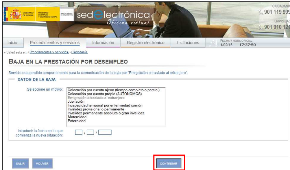
Ilustración 2: Datos de la baja

II) A continuación aparece un desplegable en el que se debe indicar el motivo de la baja y la fecha en la cual comienza a aplicarse.