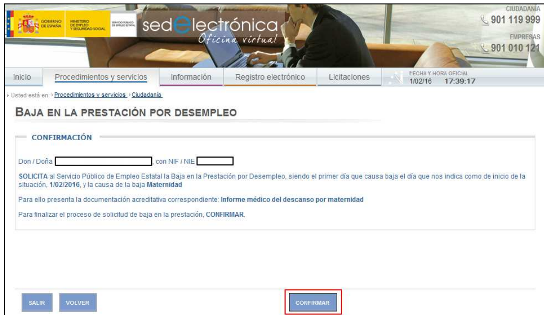
Ilustración 4: Conformidad de la baja en la prestación

IV) Para formalizar la solicitud se requiere la confirmación de la misma: